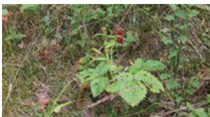
Ароматная лесная земляника

Далее представится возможность почувствовать себя робинзоном и преодолеть участок смешанного леса, где произрастают ели, серая ольха, осина. Участок не простой, но небольшие трудности лишь добавляют долю экстрима и закаляют характер. Здесь, может, не обошлось без встреч со следами животных: енотовидной собаки, кабанов, лосей. А какое удовольствие можно получить, глядя на окрестные пейзажи озера Березово?! Здесь отлично читается холмисто-западинный рельеф Валдайской возвышенности. Далее дорога идет с одной стороны вдоль луга с душицей и озера с другой. Перейдя дорогу, ведущую на Ивантеево, предстает сосновый бор.