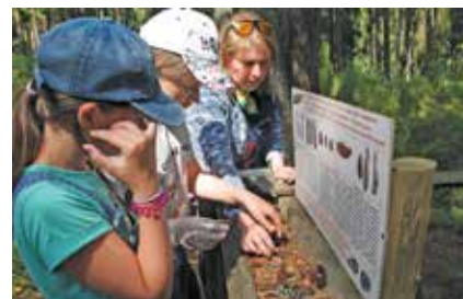
Обновление экспонатов музея под открытым небом

После рассказа ребята приняли участие в волонтерском субботнике: вымыли все информационные стенды на экомаршруте, обновили демонстрационный материал для музея под открытым небом, собрав погрызы еловых и сосновых шишек, а также убрали мусор.