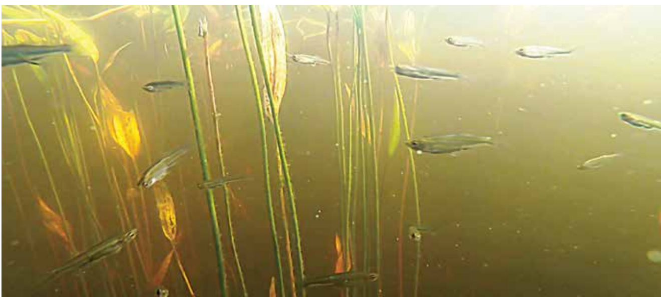
В рыбьем «детском саду» царит суэта