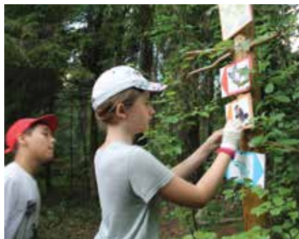
По чистым указателям и ориентироваться приятнее

Этот конкурс проводится Министерством культуры Российской Федерации и Всероссийским общественным движением «Волонтеры Победы» в целях популяризации экологического туризма, формирования идеи активного и здорового образа жизни, привлечения внимания широкой общественности к важности развития экологических троп (маршрутов) в регионах России. Название конкурса выбрано не случайно, ведь «зеленые маршруты» – это туристские маршруты (экологические тропы), включающие привлекатель-