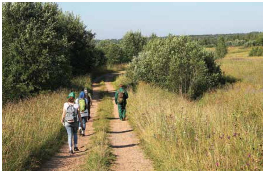
В начале пути

Работа над созданием туристского маршрута «Большая Валдайская тропа», о котором уже многие слышали, идет полным ходом.