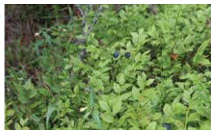
Лес угостил нас и черникой

Кроме земляники, встречались и кусты черники.