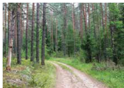
Сосновый лес хорош в любое время года

Несмотря на то, что сейчас время не самое подходящее для наслаждения пением птиц, на протяжении всего маршрута к озеру Находно мы могли слышать их разные трели.