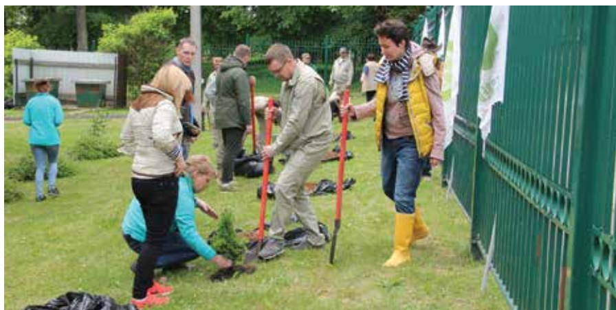
Посадка аллеи «Заповедное кольцо»

Субботнее утро 9 июня в Визит-центре парка выдалось насыщенным во многом благодаря участникам автопробега «Заповедное кольцо».