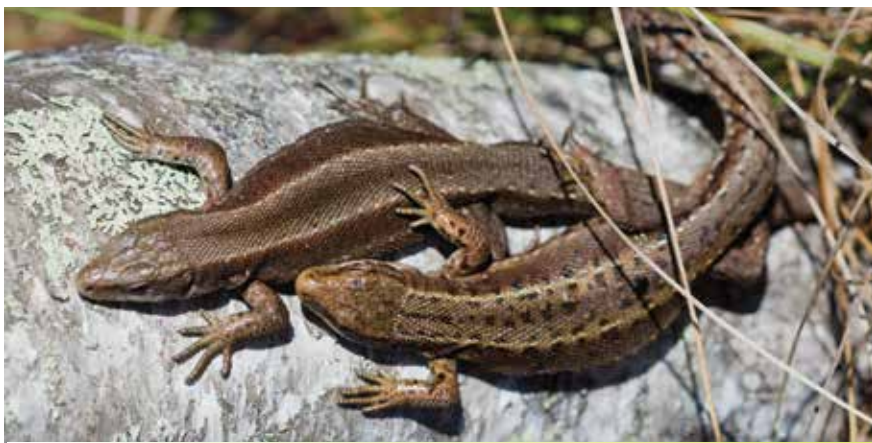
Две живородящие ящерицы

Подробнее о национальном парке «Валдайский» вы сможете узнать на нашем сайте - http://valdaypark.ru и в группе Вконтакте http://vk.com/valdaypark