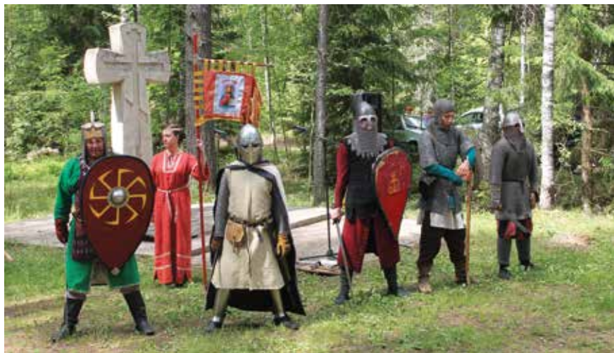
На пересечении торговых путей

Быстро летит время, но есть только одно средство противостояния его скоротечности – памятные события, придающие «объем» и смысл прожитых нами лет.