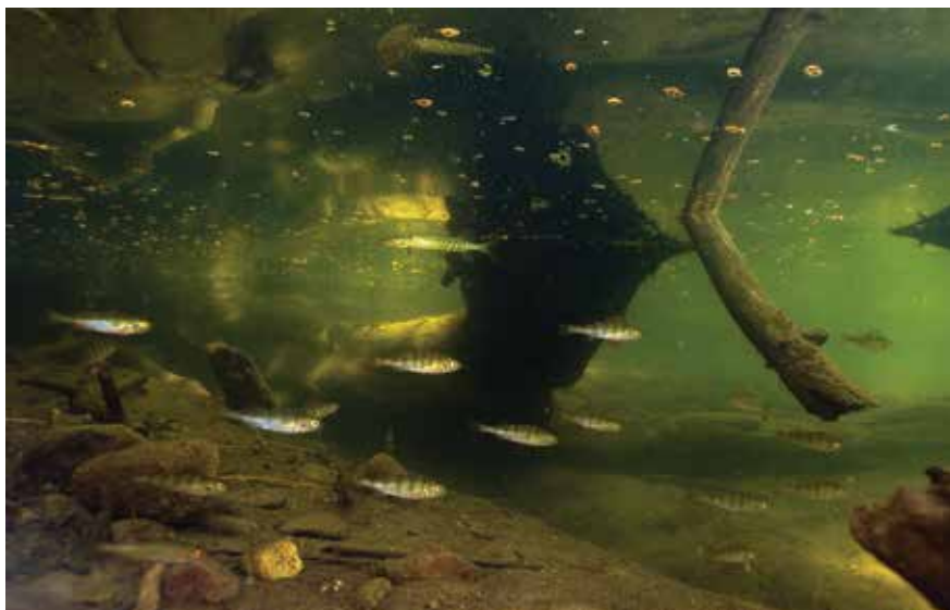
Всегда спешащие стайки окуней.