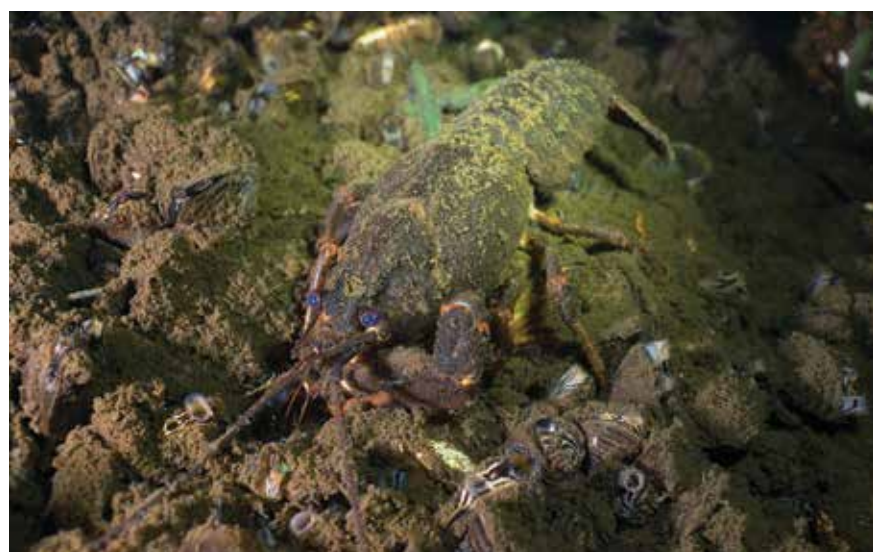
Узкопалый рак.