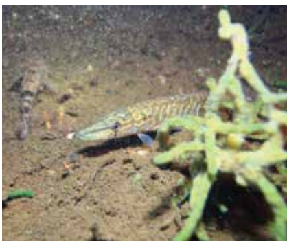
Щука в засаде.

Мы восхищаемся озерными пейзажами, но не многим удавалось увидеть подводные красоты озер. Реализация проекта «Из прудовой колыбели в валдайские озера», осуществляемого национальным парком совместно с Благотворительным фондом «Красивые дети в красивом мире» подтолкнул к сотрудничеству с фотографами