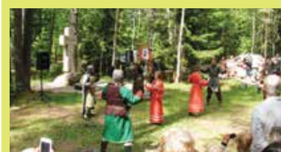
Стихотворение родилось в лесах у места установки памятного знака Игнач –крест.

Валерий Николаев, ведущий научный сотрудник