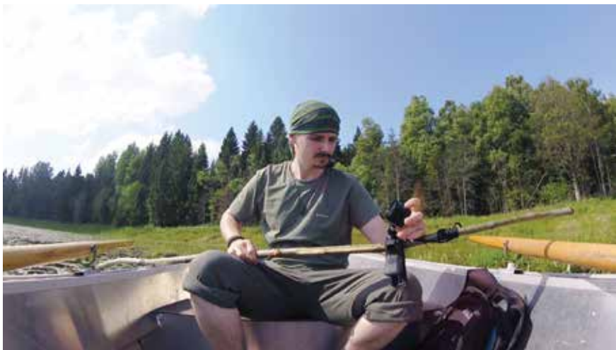
Подготовка камеры к погружению

У каждого водоема своя жизнь. У одних она короткая, у других длинная. Естественного процесса сукцессии – последовательной необратимой смены биоценозов, преемственно возникающих на одной и той же территории в результате влияния природных или антропогенных факторов, избежать не получится.