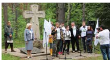
Приветственное слово гостей у памятного знака Игнач-крест

Автопробег осуществлялся на автомобилях марки УАЗ, что позволило не только протестировать качество дорог и оценить возможности путешествовать на своем транспорте по заповедным местам Центральной части нашей страны, но и привезти на особо охраняемые природные территории интересную печатную продукцию, в