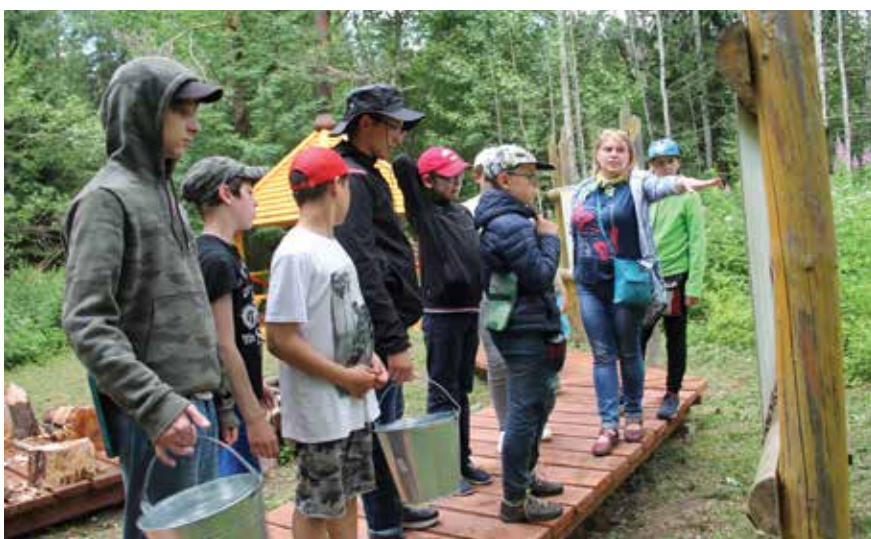
Небольшой инструктаж – и за дело