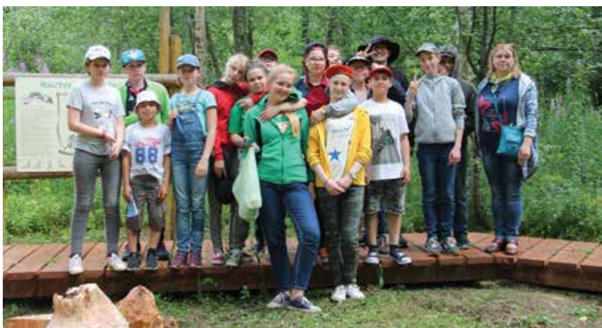
Быть волонтерами – дело почетное

2018 год Указом Президента России объявлен Годом добровольца (волонтера). В рамках Всероссийского конкурса «Зеленый маршрут» 12 июля национальный парк «Валдайский» принял на своей территории группу волонтеров из детского лагеря «Остров героев».