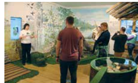
О национальном парке через экспозицию

Практически на каждой посещаемой особо охраняемой природной территории волонтеры закладывали аллеи «Заповедное кольцо». В национальном парке «Валдайский» у Визит-центра участниками автопробега и сотрудниками природоохранного учреждения были высажены саженцы ели.