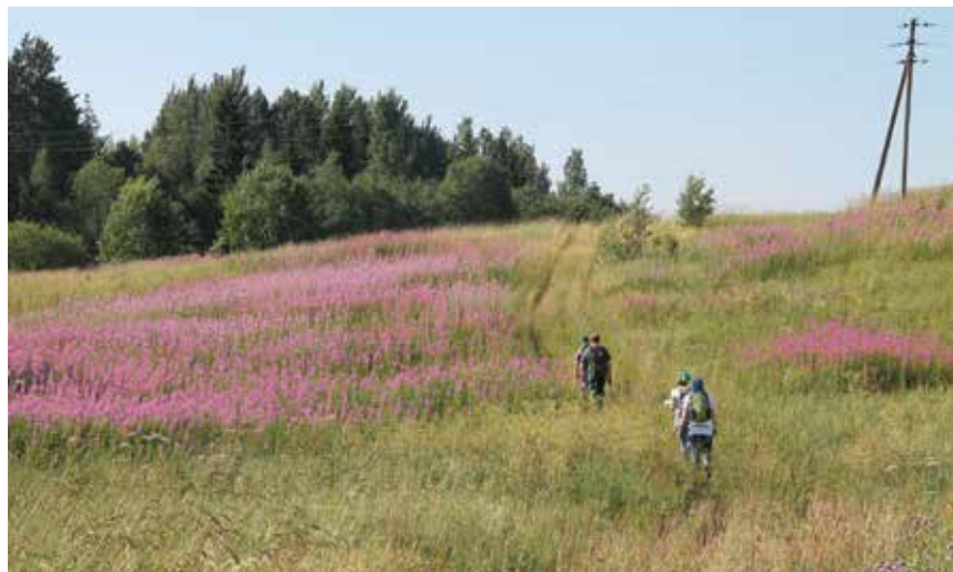
Холмы да западины – особенности валдайского рельефа

Июль – сезон созревания лесной земляники, поэтому этой ароматной ягодой смогли угоститься все участники рабочего похода.