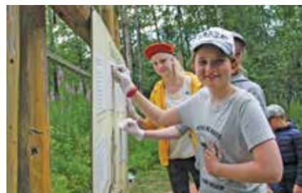
Пусть стенды на экотропе будут чистыми

ные для туристов места природного и культурного наследия, обладающие познавательным потенциалом в самых разных сферах истории, краеведения и природы в целом.