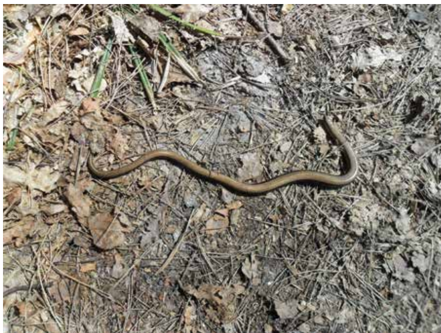
Веретеница – редкий вид, находящийся в состоянии близком к исчезновению

Веретеница может служить и хорошим объектом для эколого-просветительской работы. Облик ее необычен и привлекателен. Небольшое, с карандаш или немногим более, змеевидное гладкое, блестящее тело, словно отлитое из пластмассы. По мере роста животного спина постепенно темнеет, а бока и брюшная сторона светлеют, взрослые самцы часто одноцветные. В отличие от змей веки глаз раздельны и подвижны, зрачок круглый, хвост ломкий. Активна преимущественно в сумерках и ночью. Яйца не откладывает, они развиваются в теле самки. В середине лета появляются на свет около десятка детенышей. Питаются веретеницы мелкой животной пищей: червями, моллюсками, насекомыми и их личинками и другими беспозвоночными. Осенью веретеницы уходят на зимовку, забираясь в норы грызунов, в пустоты под корнями деревьев и прочие укрытия. В мировой фауне насчитывается 78 видов веретеницевых ящериц, но большинство из них обитают в Северной и Центральной Америке. Маленькая веретеница напоминает всем нам, насколько удивителен и прекрасен в своих разнообразных проявлениях окружающий мир живой природы.