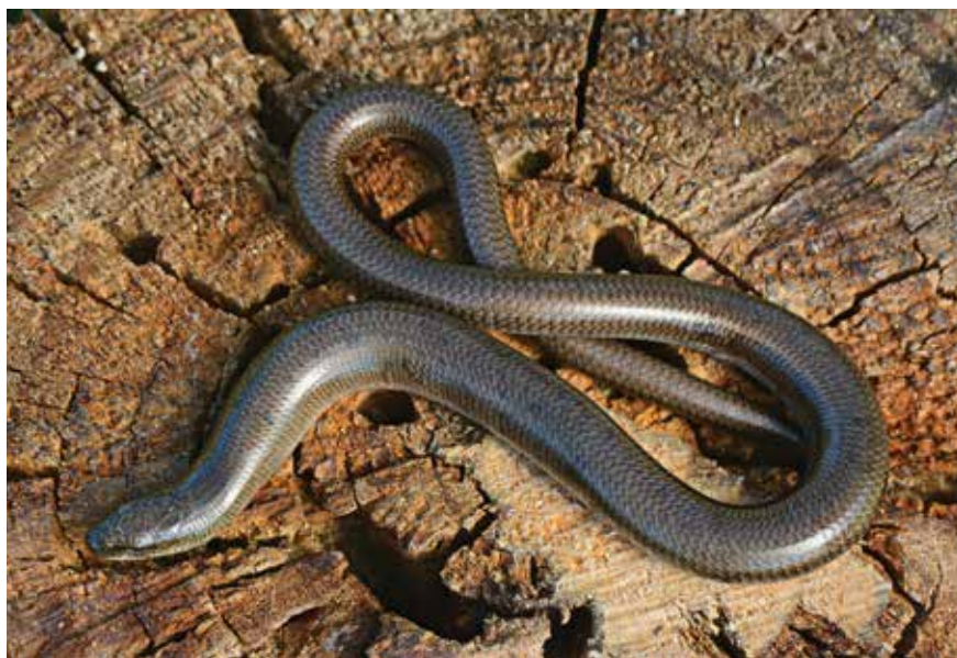
Эту безногую ящерицу часто принимают за змею и уничтожают