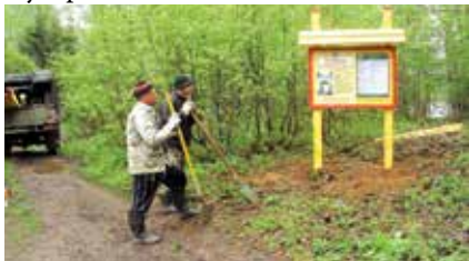
Установка информационного аншлага