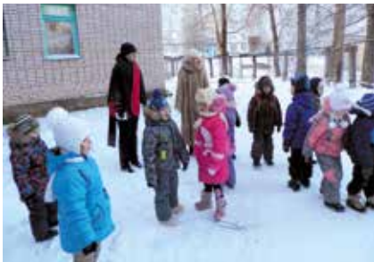
Играя вспоминаем птиц

отдел экологического просвещения национального парка «Валдайский» для школьников в возрасте 10 – 13 лет объявил конкурс проектных работ «Каждой пичужке - наша