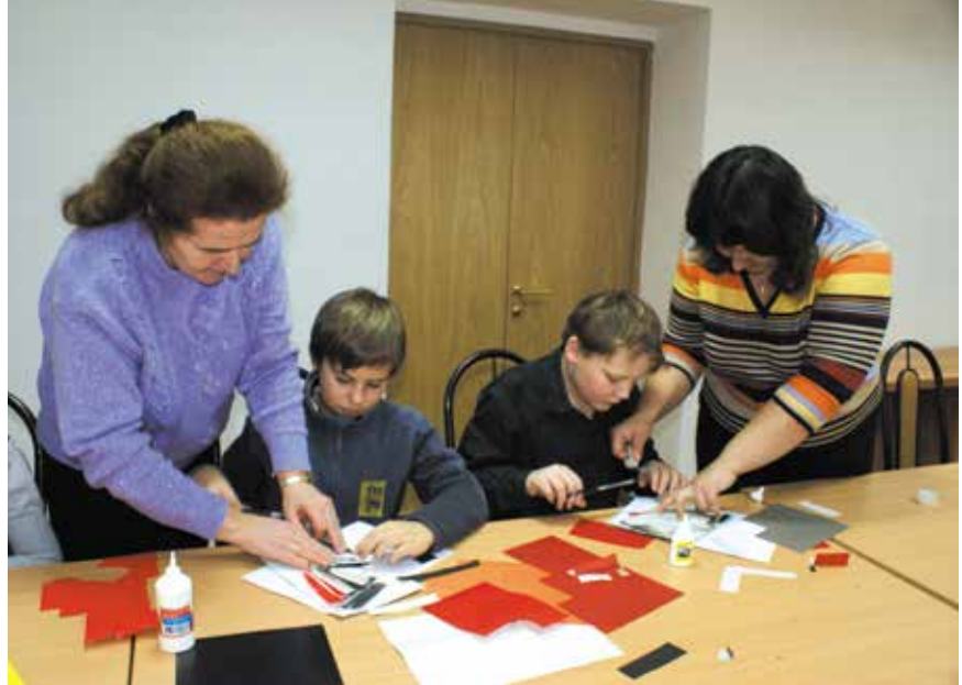
Мастер-класс для школьников

• Совместно с Валдайским ЛПУ МГ филиала ООО «Газпромтрансгаз»