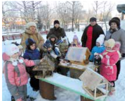
Прилетайте пичужки на наши кормушки

кормушка». По его условиям участникам предлагается построить кормушку, разместить в удобном для птиц месте и провести наблюдения за гостями рукотворной столовой. Очень важно запечатлеть посетителей кормушки и составить дневник, отразив в нем разнообразие пернатых, какое угощение было наиболее востребованным и другие интересные на взгляд наблюдения моменты. Руководствуясь разработанным положением о конкурсе, в назначенный срок к нам поступило 115 заявок от юных исследователей на участие в проекте, причем из разных уголков Новгородской области.