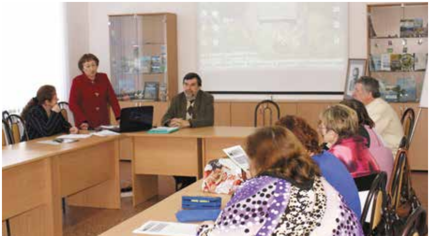
В преддверии полевого сезона