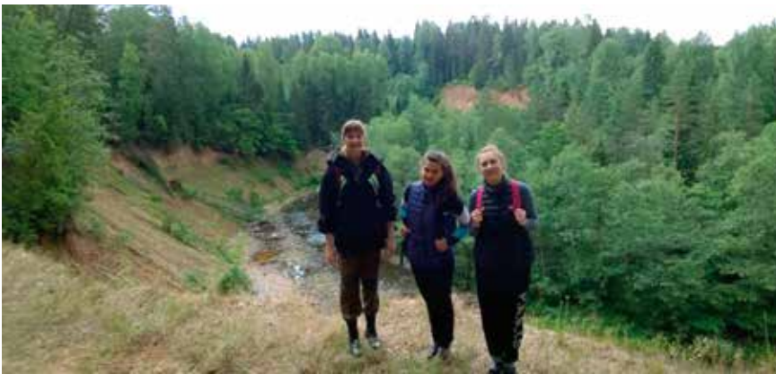
На крутом берегу Поломети

Днем и ночью вспоминаем Красоту и свет Валдая, Круговерть затей, идей И прекраснейших людей!!!