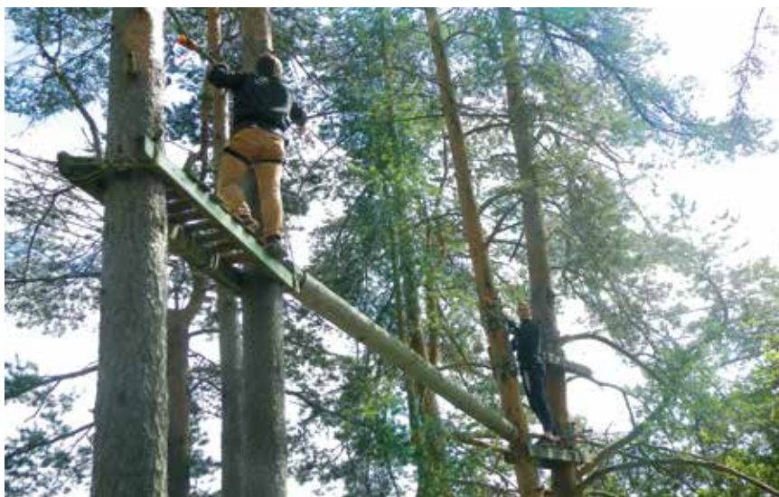
В лагере «Валдайская Робинзоада»

Пожалуй, самым долгожданным моментом для сотрудников парка стало осуществление второго этапа работы практикантов, где они, предварительно разделившись на восемь групп, представили перед экспертами – сотрудниками различных отделов парка, свои проекты как по обновлению уже имеющихся экотроп и объектов, так и созданию совершенно новых туристских маршрутов. Особый интерес вызвали проекты по благоустройству родника «Текунок» и анимационная программа «Назад в сказку», которая рассчитана на проведение на экологической тропе «Лесные тайны». Предложенные проекты вполне могут быть реализованы. Нельзя сказать, что другие проекты не пригодны в исполнении. Отдельные их элементы