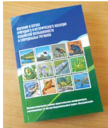
Сборник материалов научной конференции

Издание предназначено для широкого круга специалистов в области охраны природного и исторического наследия, экологического образования, краеведов, преподавателей, аспирантов и студентов и будет доступно для чтения в Валдайской районной библиотеке. Кроме того, книга пополнит библиотечные фонды областной библиотеки и будет передана во многие вузы страны. Собственный экземпляр книги получит и каждый из авторов.