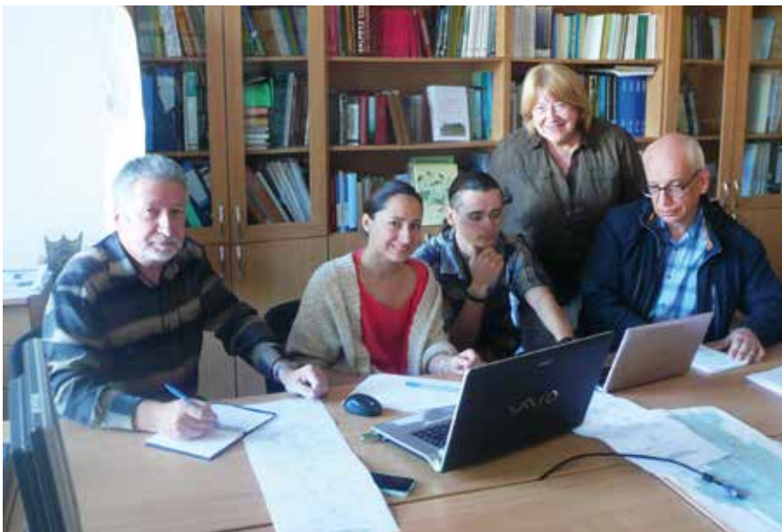
В процессе обсуждения