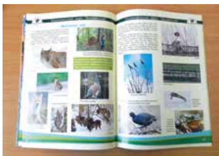
О животном мире парка

365 страниц книги, включившей в себя 65 статей, объединенных по темам, посвящены вопросам охраны природы, экологическим исследованиям, проблемам изучения и охраны биоразнообразия парка и его историко-культурного наследия, а также экологическому образованию населения и организации туризма на территории.