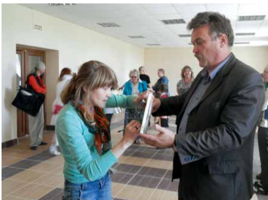
Живописное полотно в дар парку

Жанна Феропонтова, методист по ЭП