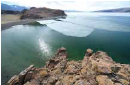
Акватория озера Толбо-Нур с массивами тающего льда

Тихомирова Марина, специалист по ЭП, фото автора