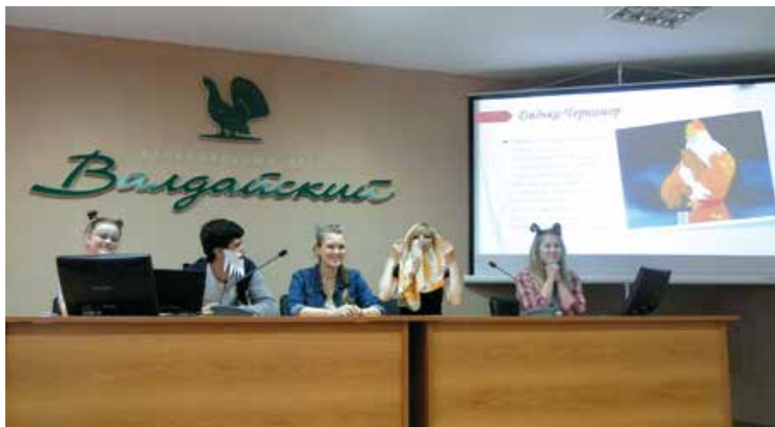
Презентация анимационной программы «Назад в сказку»

Лето для студентов – сезон практик, в том числе выездных. Самое время применить полученные теоретические знания на практике. В этом отношении, по мнению многих специалистов вузов нашей страны, Национальный парк «Валдайский» идеален. Здесь и транспортная доступность, и возможность организации быта, и самостоятельного питания, и самая главная составляющая – природа. Здесь раздолье для гидрологов, геологов, географов и биологов, геохимиков, ландшафтоведов, будущих специалистов туристской индустрии.